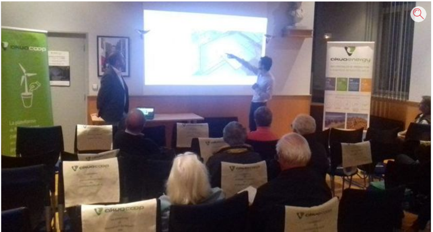
La réunion a rassemblé une quinzaine de personnes.

Le projet de centrale solaire mêlant énergie et agriculture a été présenté cette semaine en salle du conseil municipal. «C'est un projet d' agri-énergie , une marque déposée il y a déjà dix ans», ont précisé les initiateurs devant une quinzaine de personnes. Mais les intéressés par ce projet de centrale solaire sont bien plus nombreux si l'on s'en réfère à la plate-forme de financement participatif relative au projet. Les responsables d'«Akuocoop» parlent déjà de près de 300 personnes, lesquelles pourront concrètement faire un don entre le 1er et le 30 novembre. Une plate-forme internet créée il y a deux ans et qui serait unique en Europe pour financer ce genre de projets environnementaux fort coûteux, la centrale de Lherm étant tout de même budgétée à 11 millions d'euros. «Le projet est financé et tout ce qui viendra en sus financera d'autres projets. Et tous les prêteurs seront remboursés et toucheront des intérêts à hauteur de 4 % l'an», précise l'animateur de la plate-forme. Étant entendu que l'ensemble des donateurs se partageront les bénéfices de l'exploitation de la centrale solaire. «Nous commencerons par des cultures innovantes, comme les plantes à parfum de style lavandes, ainsi qu'un atelier d'apiculture», indique un agriculteur de Saint-Hilaire impliqué dans le projet.